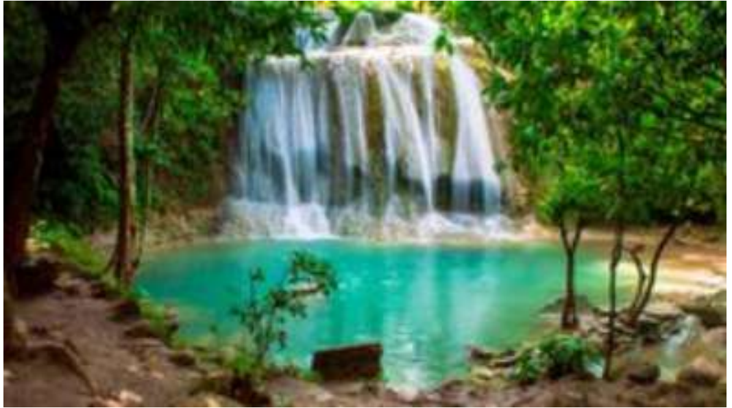
Gambar. 4. Curug Pulosari.