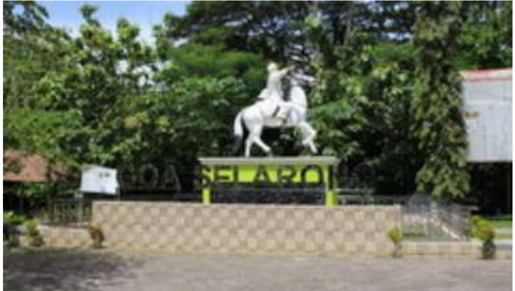
Gambar. 7. Goa Slarong

Kawasan objek wisata ini memiliki pemandangan alam yang sangat indah berupa Air terjun dan sendang Manikmaya. Di masa lampau gua ini digunakan sebagai markas gerilya Pangeran Diponegoro dalam perjuangannya melawan penjajahan Belanda pada tahun 1825 - 1830.