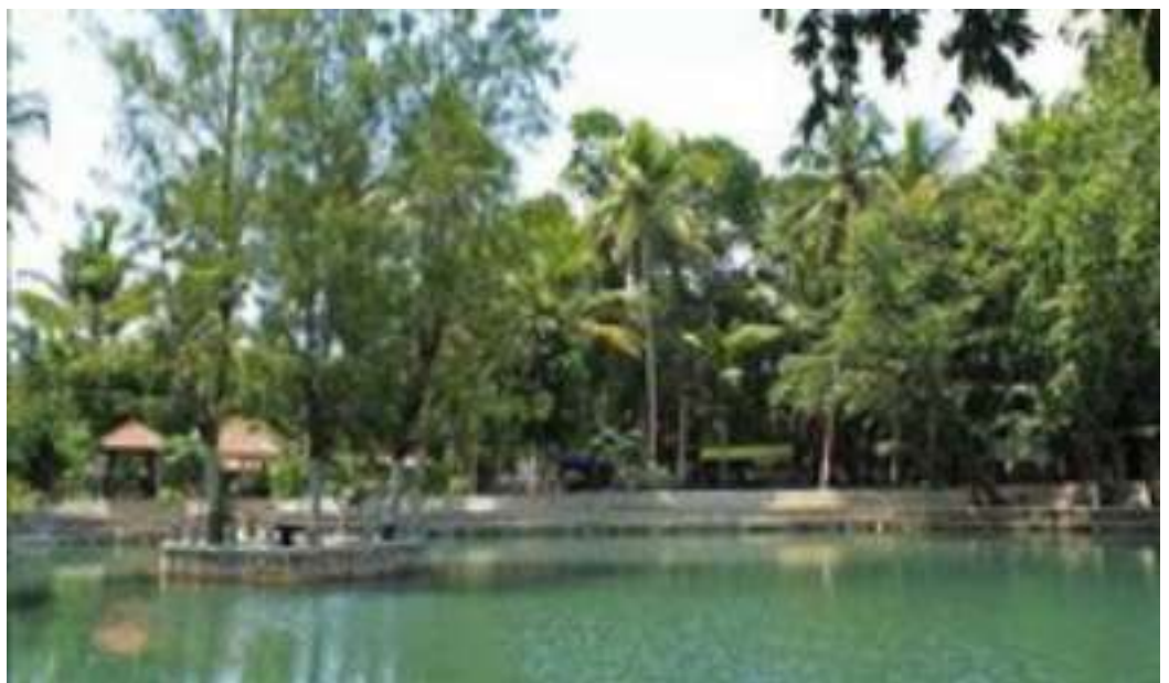
Gambar. 5. Sendang Ngembel

Terletak di Beji Wetan, RT.03, Beji Wetan, Sendangsari, Kec. Pajangan, Bantul, Daerah Istimewa Yogyakarta 55751. Begitu sampai di lokasi, mata akan disugahi kolam air berdinding tembok yang dikelilingi pohon rindang dengan luasan kolam sekitar 200 meter. Sendang Ngembel tak hanya sekedar tempat rekreasi, pulau di tengah kolam, dipercaya sebagai penanda batas Mangir dan Kerajaan Mataram Islam yang diletakkan oleh Ki Ageng Mangir Wonobudoyo.