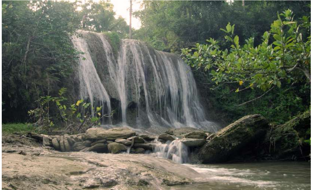
Gambar.3. Curug Banyunibo

Tempat ini masih alami dan belum banyak tersentuh pembangunan.