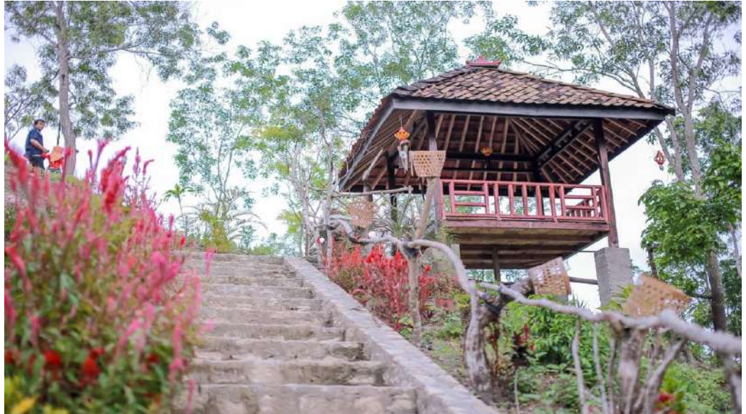
Gambar.10. Taman Gunung Mijil

Lokasi ini terletak di Dusun Gandekan, Guwosari, Pajangan, merupakan situs bersejarah, karena konon sebagai tempat pengintaian dr pasukan Diponegoro, sehingga letaknya dekat dengan Goa Slarong. Arah pengembangan kedepan, lokasi wisata keluarga ini akan dilengkapi dengan fasilitas peralatan outbond.