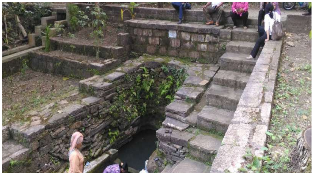
Gambar. 6. Sendang Angin Angin

Sendang Angin angin adalah salah satu sumber mata air yang terletak di dusun Guwo, Triwidadi, Pajangan, Bantul, Yogyakarta. Letak geografis di dusun Guwo rt 02. Sumber mata air ini tak pernah kering walau musim kemarau jadi ketika kalian berkunjung saat musim kemarau akan ada dapati. Upacara adat kurus Sendang Angin-angin dilaksanakan 1 (satu) tahun sekali yaitu pada Bulan Maulud bertepatan dengan peringatan Maulud Nabi Muhammad SAW, sebagai rasa syukur atas karunia sendang atau mata air ini yang dapat mencukupi kebutuhan air bersih warga sekitarnya.