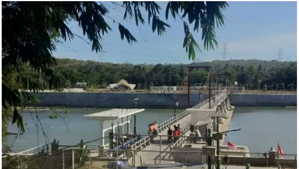
Gambar.8. Bendung Kamijoro

diperbaiki oleh Pemerintah. Peresmian bendungan ini sendiri baru dilakukan pada Selasa (31/12/2019) lalu oleh Presiden Joko Widodo.