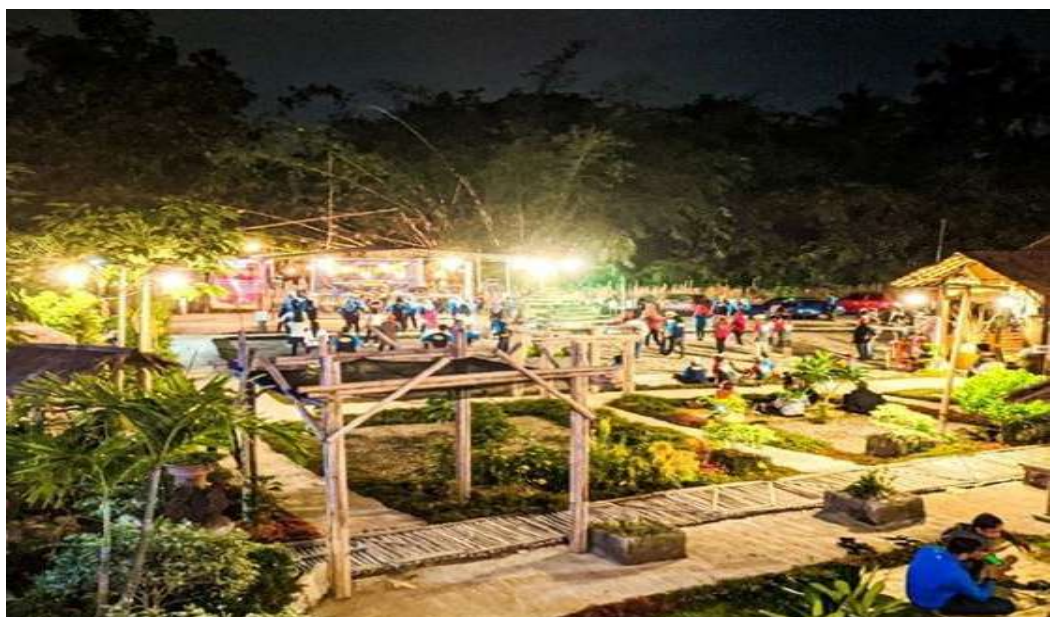
Gambar. 9. Taman Jati Larangan

Terletak di Iroyudan, Guwosari, Pajangan, Bantul Yogyakarta 55751, lokasi wisata ini masih terus berbenah dan mempercantik diri, cocok untuk wisata keluarga sekaligus sejarah, dimana lokasi ini terdapat makam Senopati Iroyudho yang merupakan salah satu punggawa kerajaan Mataram.