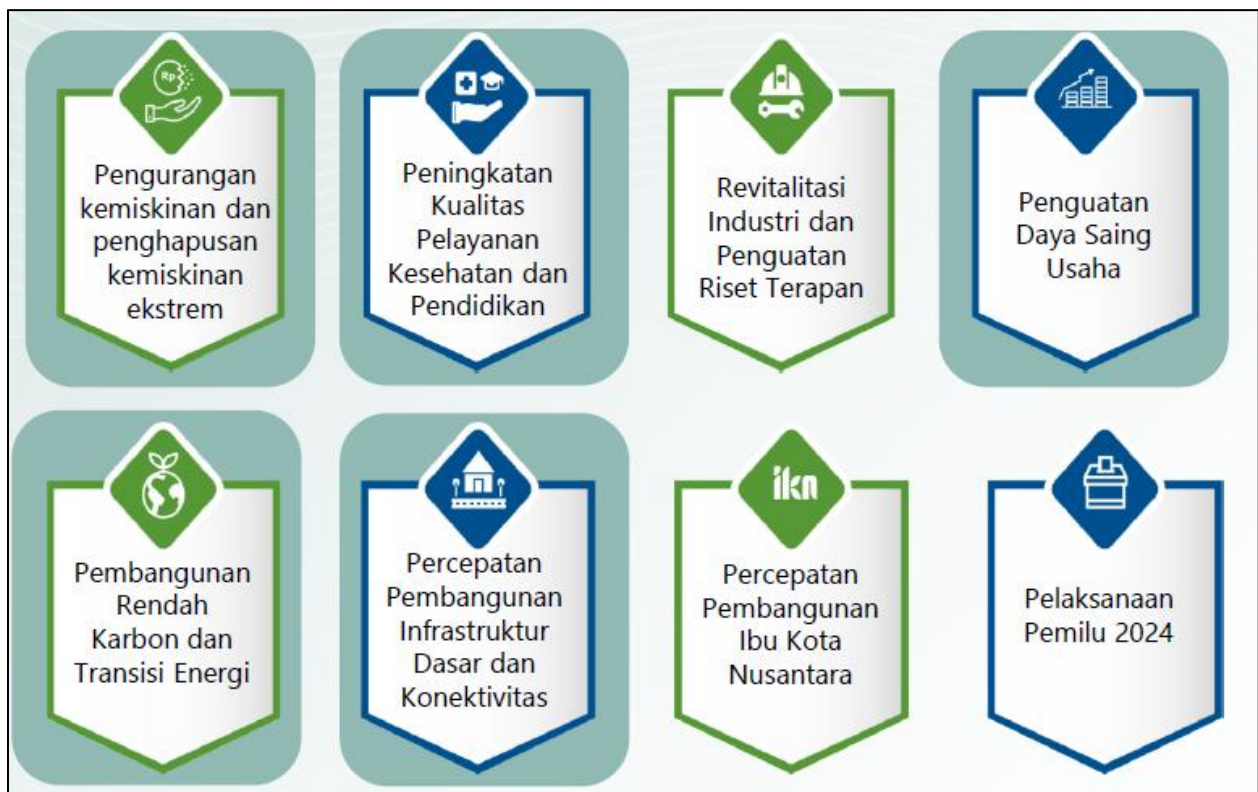
Gambar 3.1 Arah kebijakan RKP Tahun 2024

Tema dan arah kebijakan RKP Tahun 2024 tersebut mendukung 7 Prioritas Nasional (PN) sesuai 7 agenda pembangunan di dalam RPJMN Tahun 2020-2024, yaitu: